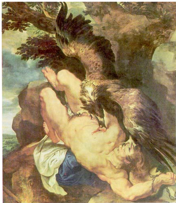
Peter Paul Rubens i Frans Snyders Prometeusz skowany , 1611-1612