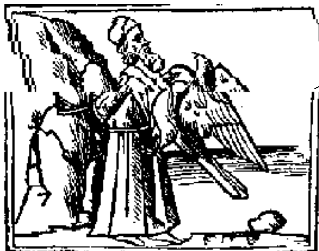
Prometeusz Rycina XVI w.